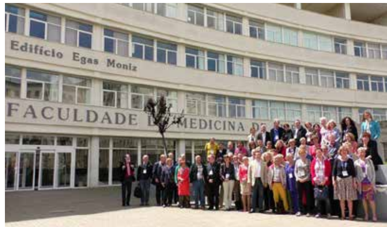
Les membres de l'ECH devant la faculté de Médecine de Lisbonne